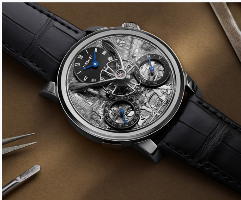
LM Split Escapement Eddy Jaquet