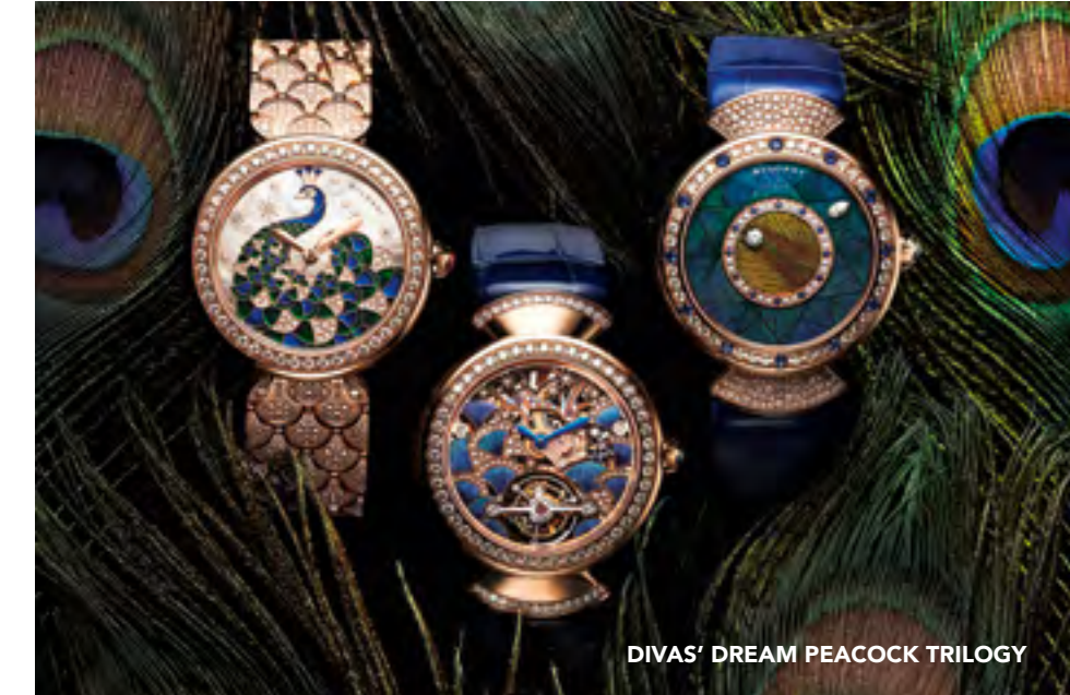
DIVAS' DREAM PEACOCK TRILOGY