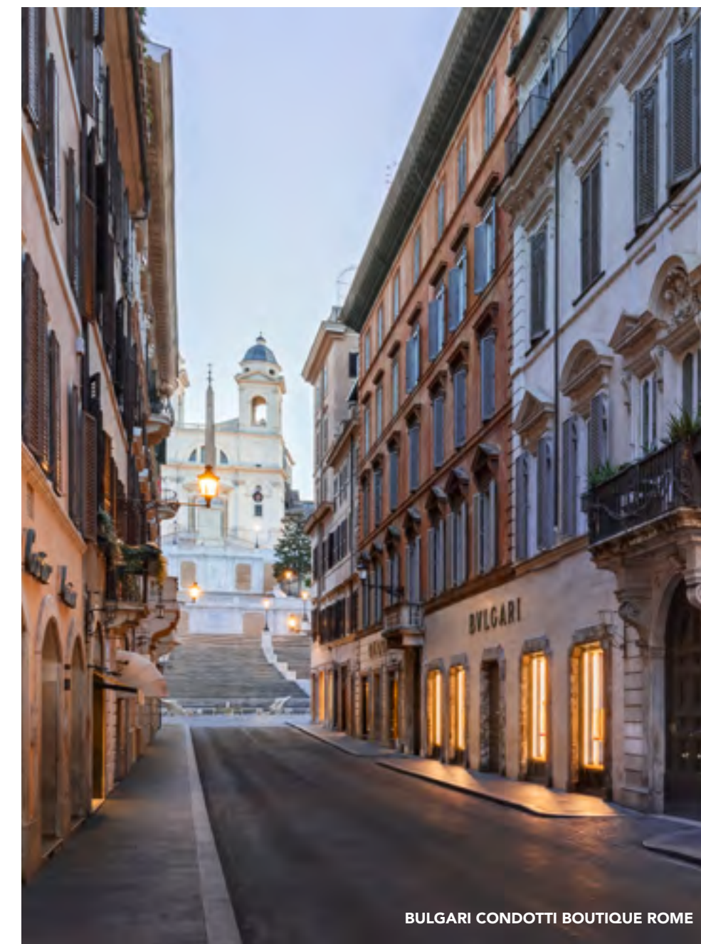
BULGARI CONDOTTI BOUTIQUE ROME