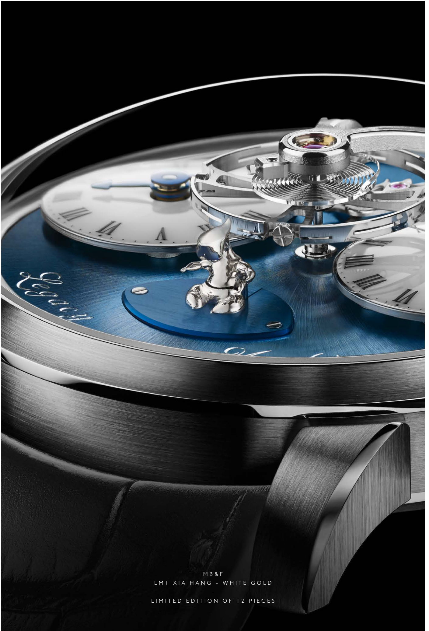
MB&F LMI XIA HANG - WHITE GOLD - LIMITED EDITION OF 12 PIECES