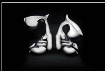
MR. UP & MR. DOWN