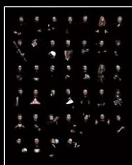
LMI XIA HANG FRIENDS