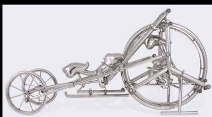
SCULPTURE 1 'COMING SOON'

PARA MAYOR INFORMACIÓN POR FAVOR CONTACTE A: CHARRIS YADIGAROGLOU, MB&F SA, RUE VERDAINE II, CH-1204 GENEVA, SWITZERLAND EMAIL: CY@MBANDF.COM TEL: +41 22 508 10 33