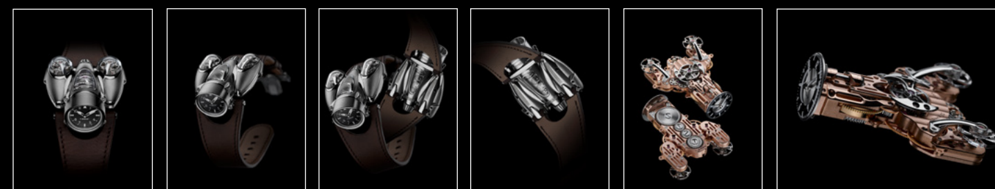
HM9 Flow Titanium Air Edition, HM9 Flow Titanium Air Edition, HM9 Flow Titanium Air Edition, HM9 Flow Titanium Air Edition, HM9 Flow Titanium Engine 01, HM9 Flow Titanium Engine 02