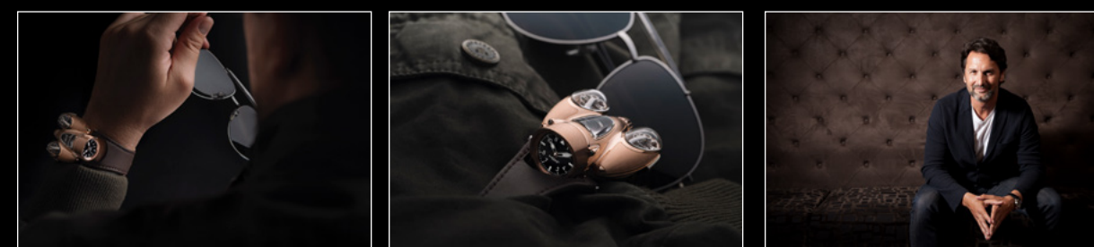
HM9 Flow Red Gold 'Air Edition' Lifestyle, HM9 Flow Red Gold 'Air Edition' In-situ, MAXIMILIAN BÜSSER PORTRAIT