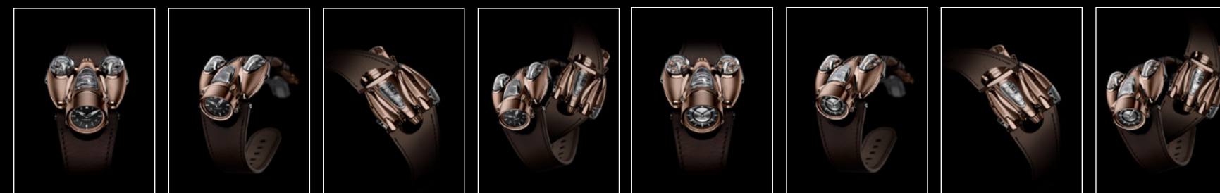
HM9 Flow Red Gold Air Edition, HM9 Flow Red Gold Air Edition, HM9 Flow Red Gold Air Edition, HM9 Flow Red Gold Air Edition, HM9 Flow Red Gold Road Edition, HM9 Flow Red Gold Road Edition, HM9 Flow Red Gold Road Edition, HM9 Flow Red Gold Road Edition