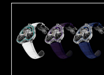
HM3 FROG X COLLECTION WHITE BACKGROUND