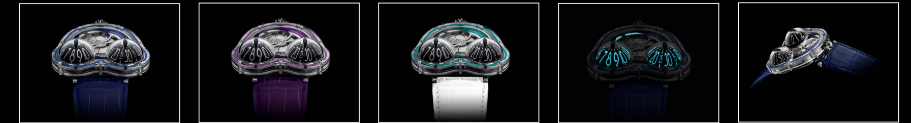
HM3 FROG X FACE BLUE