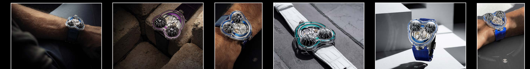
HM3 FROG X WRISTSHOT BLUE