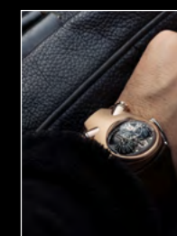
HM10 BULLDOG RG WRISTSHOT