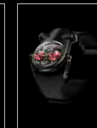
HM10 DARK BULLDOG RED FRONT