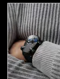
HM10 DARK BULLDOG BLUE WRISTSHOT