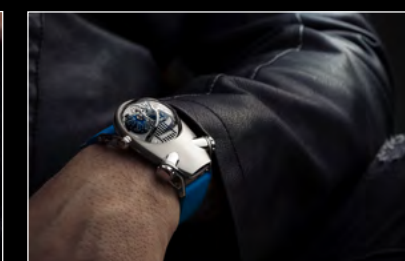
HM10 BULLDOG RG WRISTSHOT