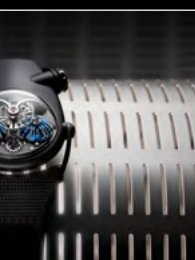
HM10 DARK BULLDOG RED WRISTSHOT