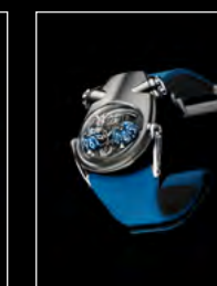
HM10 BULLDOG TI FRONT