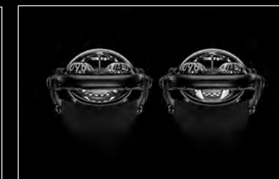
HM10 DARK BULLDOG BLACK OPEN/CLOSED