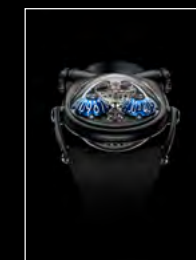
HM10 DARK BULLDOG BLUE FACE