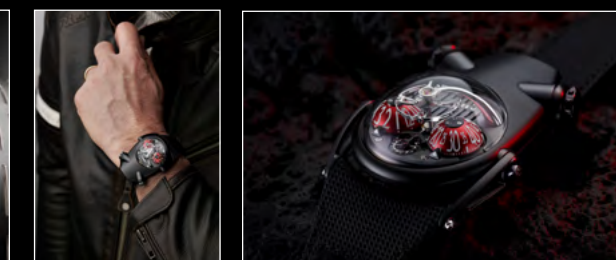
HM10 DARK BULLDOG RED LIFESTYLE