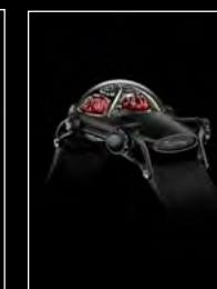
HM10 DARK BULLDOG RED REAR