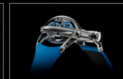
HM10 BULLDOG TI PROFILE