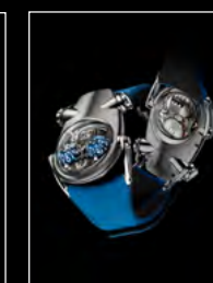
HM10 BULLDOG TI