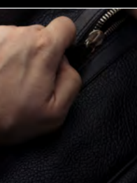
HM10 BULLDOG TI WRISTSHOT