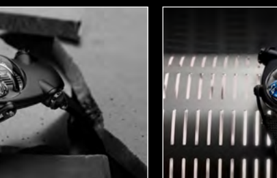
HM10 DARK BULLDOG BLUE LIFESTYLE