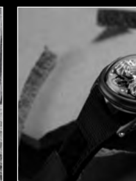
HM10 DARK BULLDOG BLACK LIFESTYLE