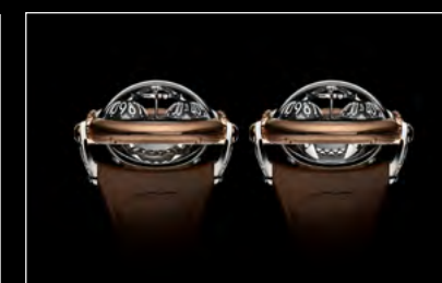
HM10 BULLDOG RG OPEN/CLOSED