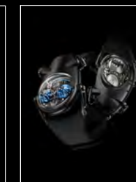
HM10 DARK BULLDOG BLUE