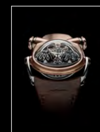
HM10 BULLDOG RG FACE