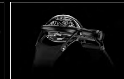
HM10 DARK BULLDOG BLACK PROFILE