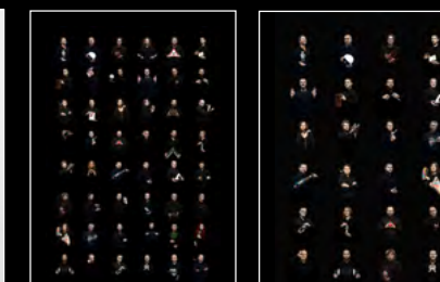
HM10 BULLDOG FRIENDS PORTRAIT