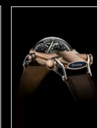
HM10 BULLDOG RG REAR