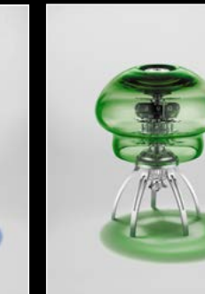
MEDUSA GREEN TABLETOP