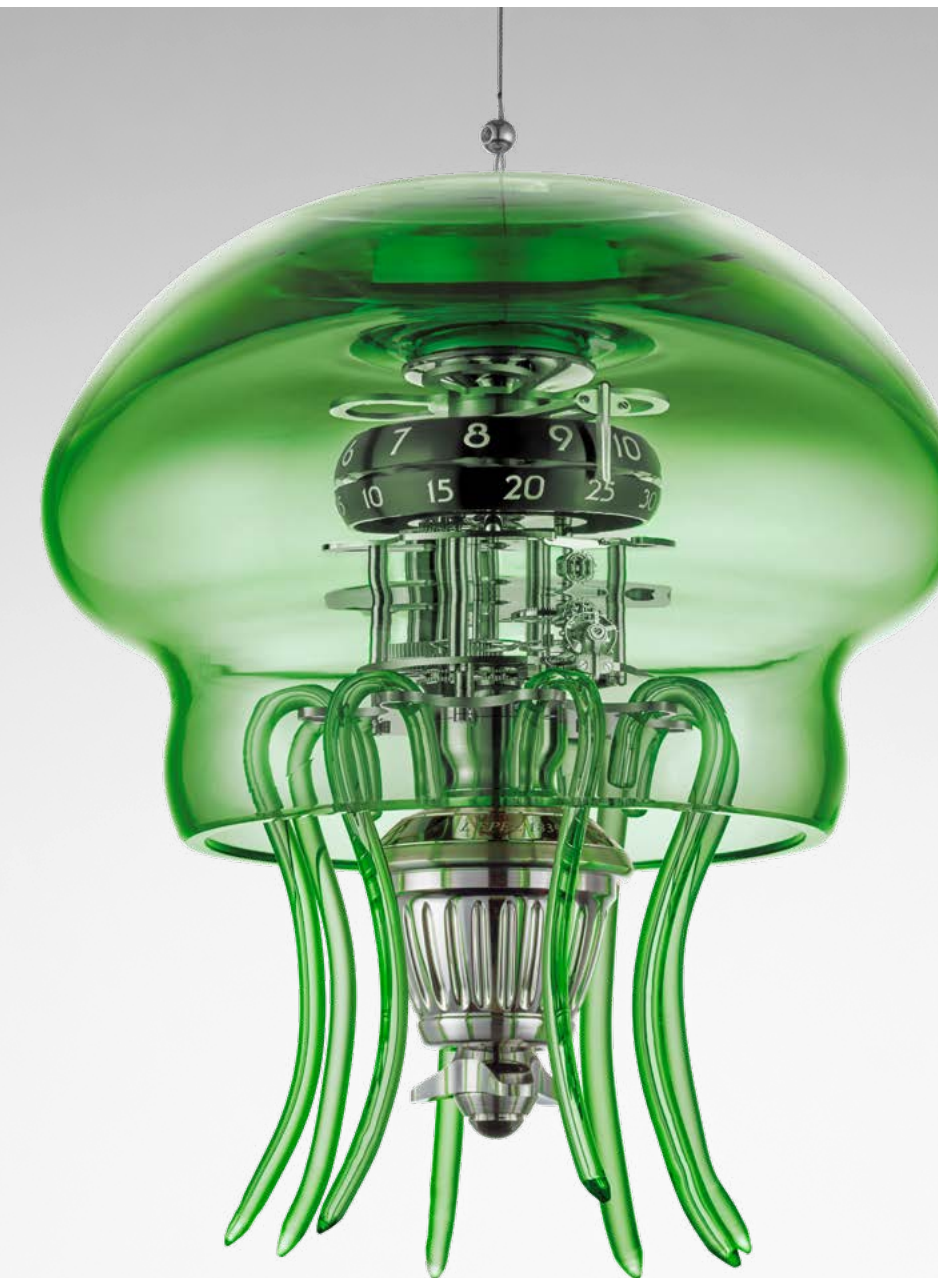
MEDUSA GREEN – SUSPENDED