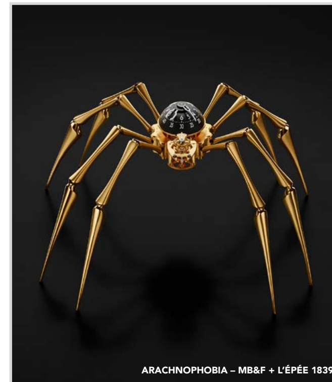
ARACHNOPHOBIA – MB&F + L'ÉPÉE 1839