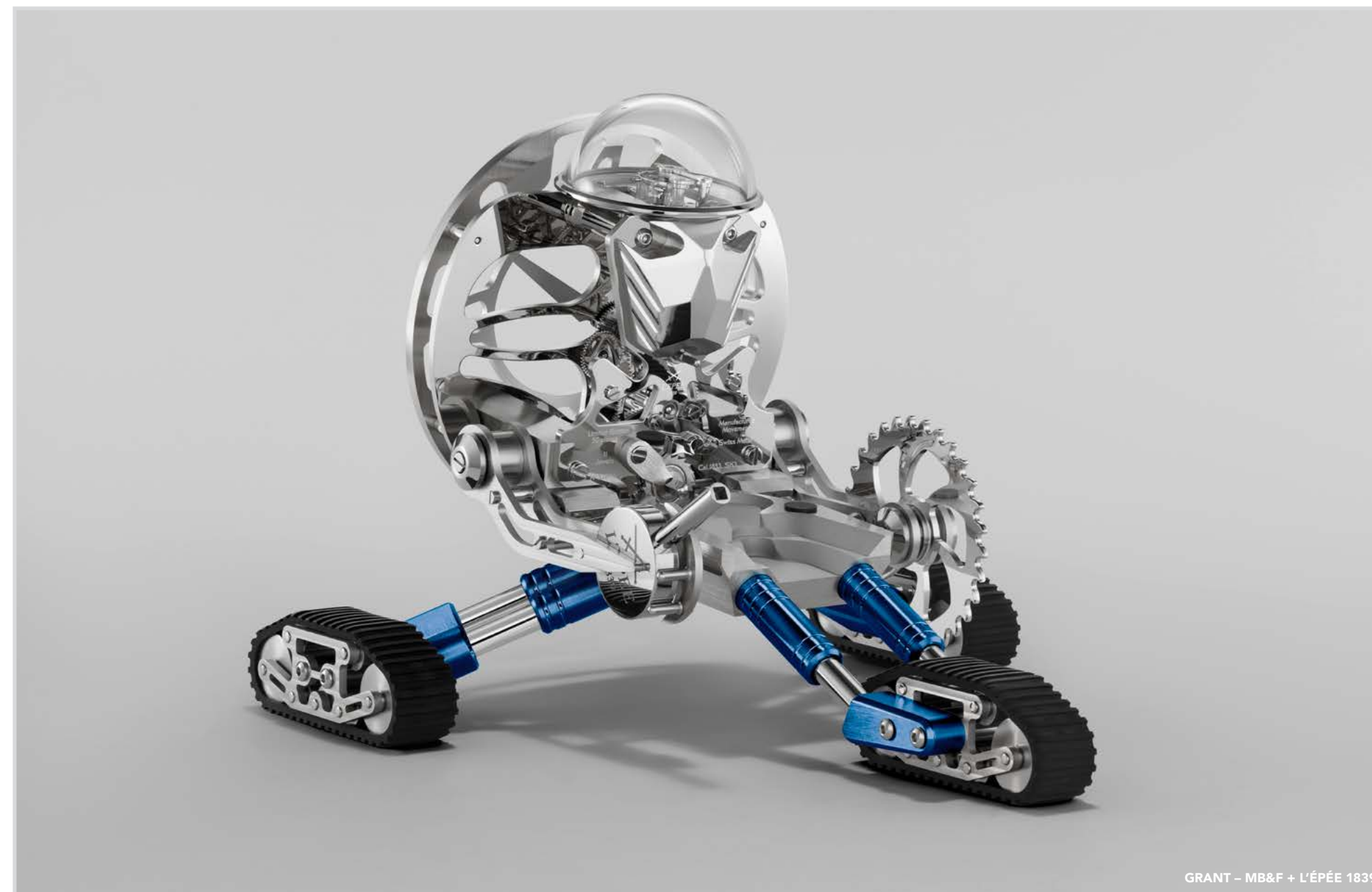
GRANT – MB&F + L'ÉPÉE 1839