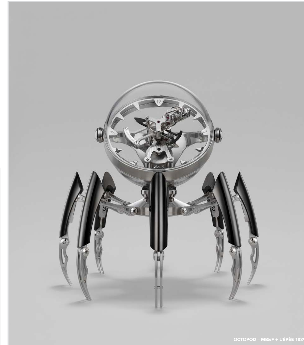
OCTOPOD – MB&F + L'ÉPÉE 1839