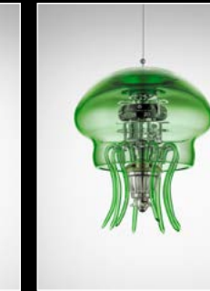
MEDUSA GREEN SUSPENDED