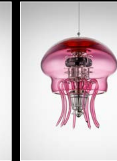
MEDUSA PINK SUSPENDED