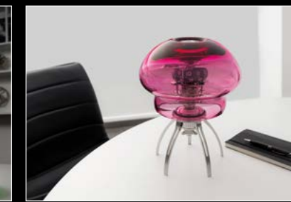
MEDUSA PINK IN SITU 02