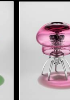
MEDUSA PINK TABLETOP