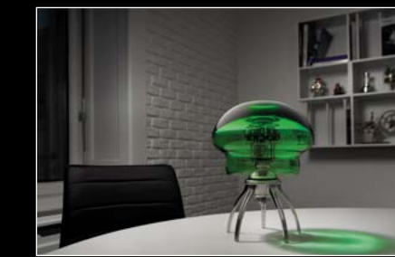
MEDUSA GREEN IN SITU 01