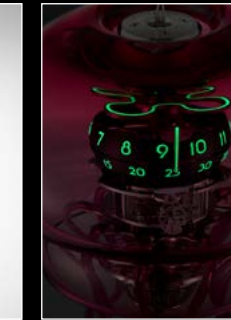
MEDUSA ENGINE SUPER-LUMINOVA