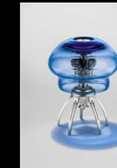
MEDUSA BLUE TABLETOP