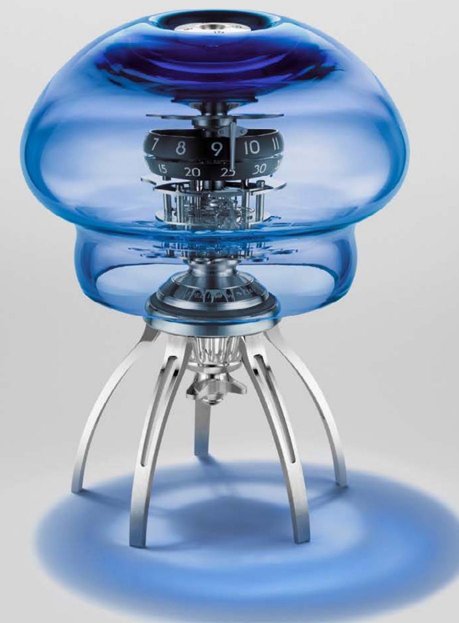
MEDUSA BLUE – TABLETOP