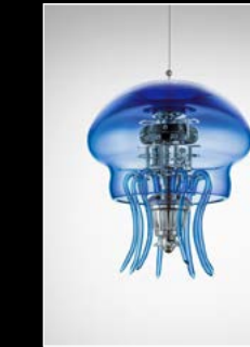
MEDUSA BLUE SUSPENDED