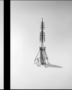
ASTROGRAPH RHODIUM MATT ASTRONAUT