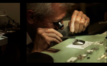
MB&F WORKSHOP 4