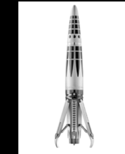
ASTROGRAPH RODHIUM MATT OPEN