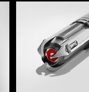
ASTROGRAPH CLOSE-UP JET ENGINE