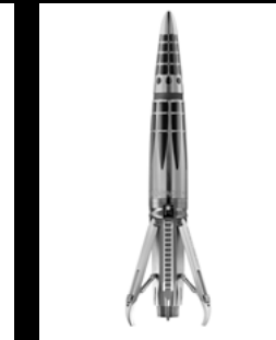
ASTROGRAPH RUTHENIUM OPEN