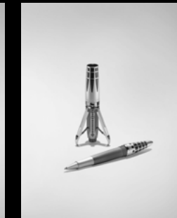
ASTROGRAPH RODHIUM MATT (ROLLER PEN)