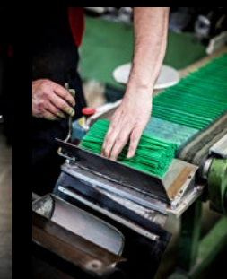
CARAN D'ACHE EXTRUSION OF LEADS