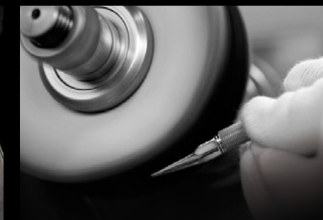
CARAN D'ACHE MANUAL POLISHING