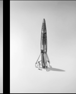
ASTROGRAPH RUTHENIUM ASTRONAUT