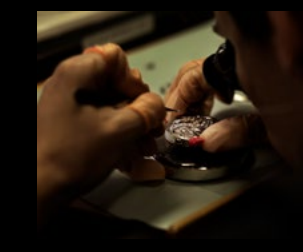
MB&F WORKSHOP 1