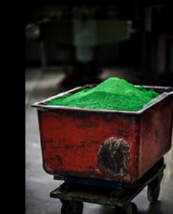
CARAN D'ACHE SAVOIR FAIRE