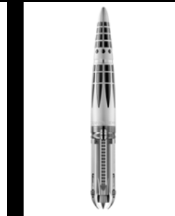
ASTROGRAPH RODHIUM MATT CLOSED