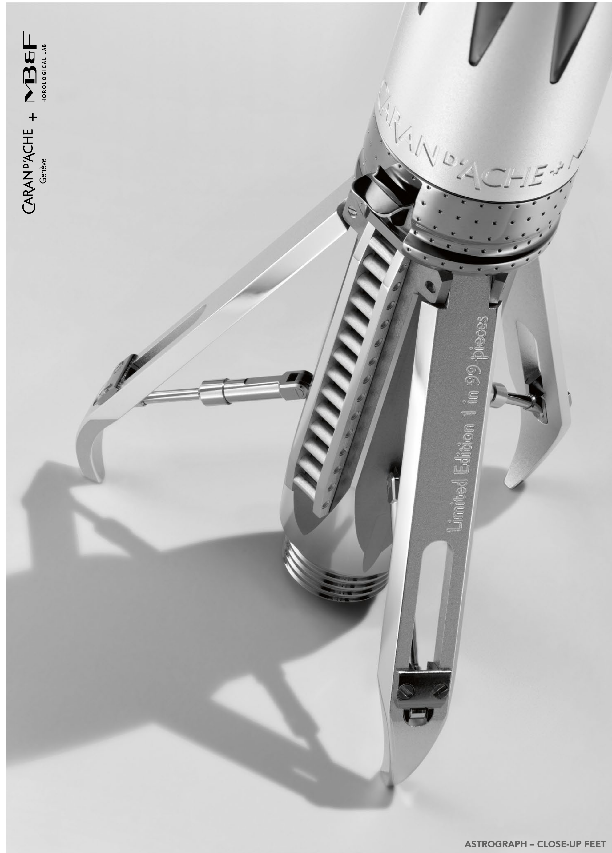
ASTROGRAPH - CLOSE-UP FEET

CARAN D'ACHE + MB&F Genève HOROLOGICAL LAB