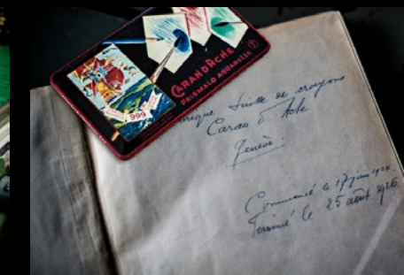
CARAN D'ACHE HISTORY