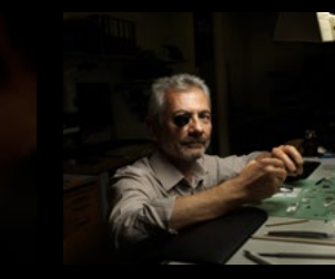
MB&F WORKSHOP 2