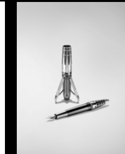
ASTROGRAPH RHODIUM HIGH GLOSS