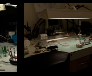
MB&F WORKSHOP 3