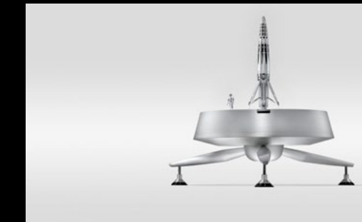
ASTROGRAPH SET PROFILE