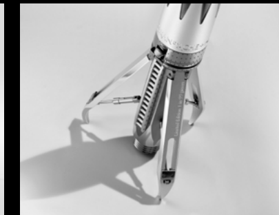
ASTROGRAPH CLOSE-UP FEET