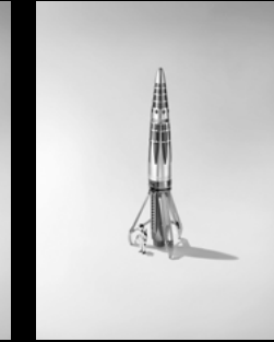
ASTROGRAPH RHODIUM HIGH GLOSS ASTRONAUT