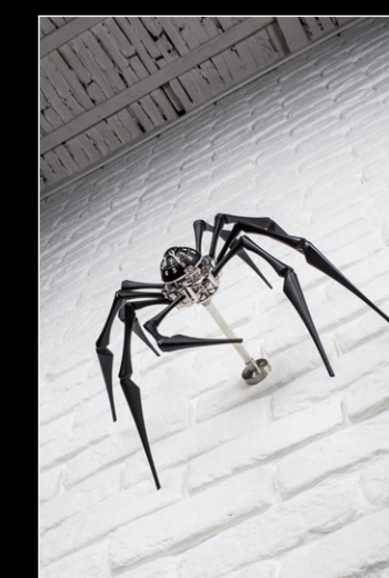
ARACHNOPHOBIA IN SITU 1