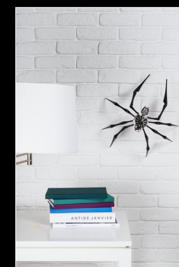
ARACHNOPHOBIA IN SITU 2