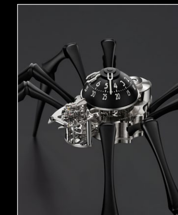
ARACHNOPHOBIA BLACK CLOSE UP