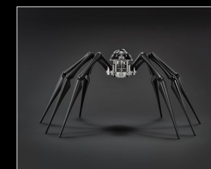
ARACHNOPHOBIA BLACK FACE