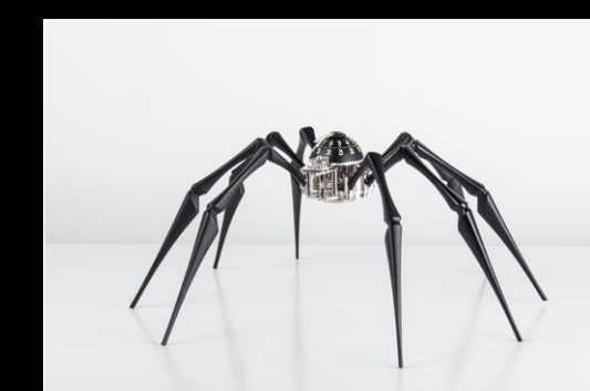
ARACHNOPHOBIA IN SITU 3