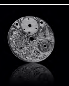
MB&F × EDDY JAQUET LM SPLIT ESCAPEMENT H2 CADRAN