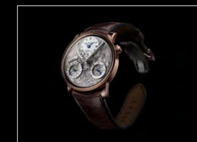
MB&F × EDDY JAQUET LM SPLIT ESCAPEMENT H5 FRONT