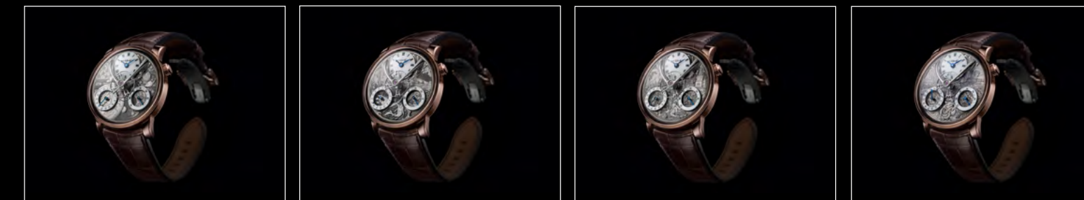
MB&F × EDDY JAQUET LM SPLIT ESCAPEMENT H1 FRONT