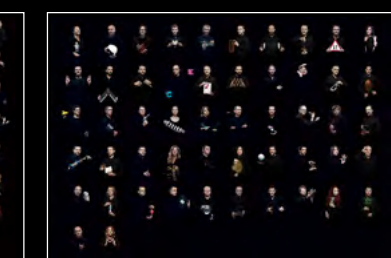
MB&F × EDDY JAQUET FRIENDS LANDSCAPE