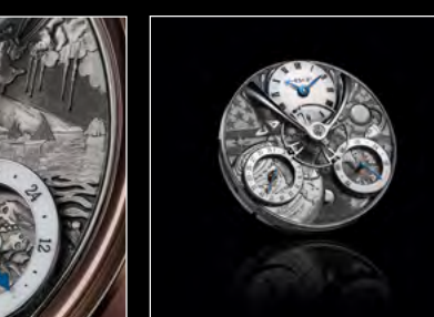
MB&F × EDDY JAQUET LM SPLIT ESCAPEMENT H2 CLOSE-UP