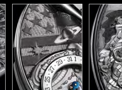
MB&F × EDDY JAQUET LM SPLIT ESCAPEMENT H1 CLOSE-UP