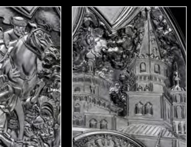
MB&F × EDDY JAQUET LM SPLIT ESCAPEMENT H3 CLOSE-UP