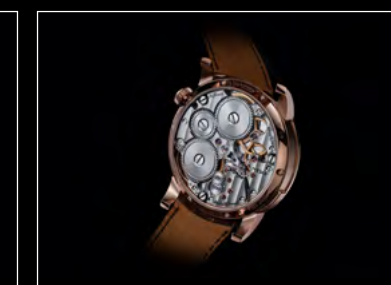
MB&F × EDDY JAQUET LM SPLIT ESCAPEMENT H2 BACK