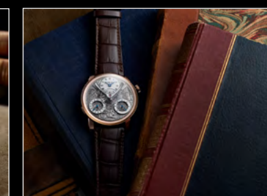
MB&F × EDDY JAQUET LM SPLIT ESCAPEMENT H3 LIFESTYLE