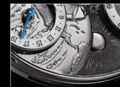
MB&F × EDDY JAQUET LM SPLIT ESCAPEMENT H1 CLOSE-UP