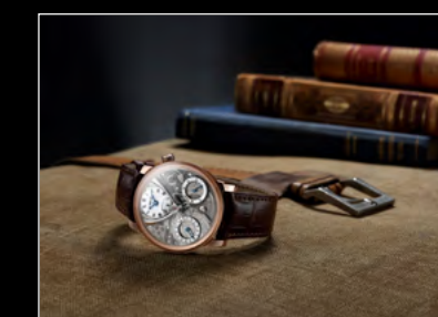
MB&F × EDDY JAQUET LM SPLIT ESCAPEMENT H1 LIFESTYLE