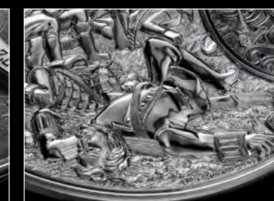
MB&F × EDDY JAQUET LM SPLIT ESCAPEMENT H3 CLOSE-UP