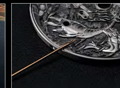
MB&F × EDDY JAQUET LM SPLIT ESCAPEMENT H2 CLOSE-UP