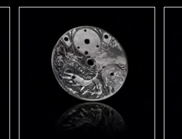
MB&F × EDDY JAQUET LM SPLIT ESCAPEMENT H1 CADRAN