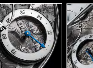
MB&F × EDDY JAQUET LM SPLIT ESCAPEMENT H1 CLOSE-UP