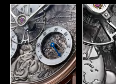
MB&F × EDDY JAQUET LM SPLIT ESCAPEMENT H4 CLOSE-UP