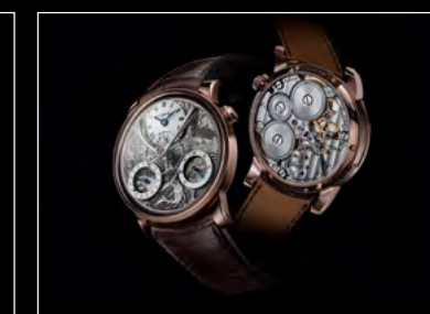
MB&F × EDDY JAQUET LM SPLIT ESCAPEMENT H2