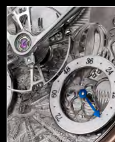
MB&F × EDDY JAQUET LM SPLIT ESCAPEMENT H5 CLOSE-UP