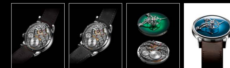
LM101 MB&F x MOSER BACK LM101 MB&F x MOSER SEDDIQI BACK LM101 MB&F x MOSER ENGINE LM101 MB&F x MOSER FACE WHITE