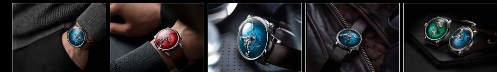
LM101 MB&F x MOSER WRISTSHOT BLUE LM101 MB&F x MOSER WRISTSHOT RED LM101 MB&F x MOSER LIFESTYLE 01 LM101 MB&F x MOSER LIFESTYLE 02 MB&F x H. MOSER LIFESTYLE