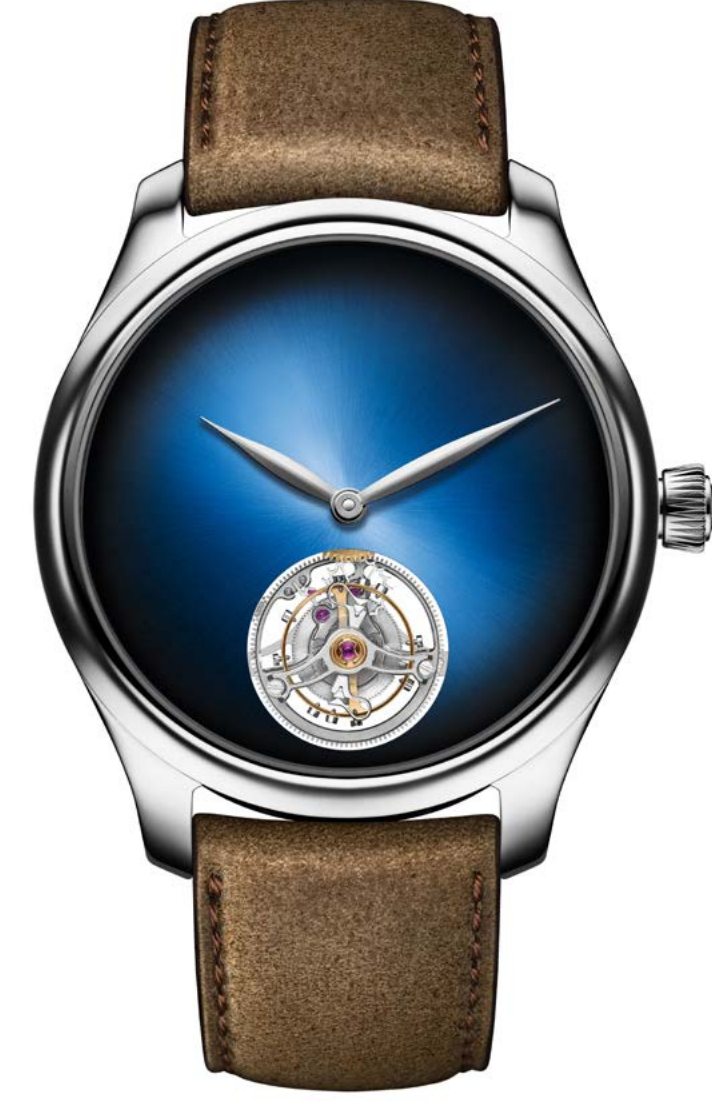
ENDEAVOUR TOURBILLON – H. MOSER & CIE.