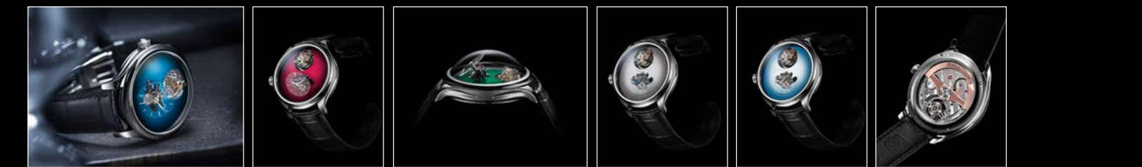
ENDEAVOUR TOURBILLON H. MOSER x MB&F ENDEAVOUR TOURBILLON H. MOSER x MB&F ENDEAVOUR TOURBILLON H. MOSER x MB&F ENDEAVOUR TOURBILLON H. MOSER x MB&F ENDEAVOUR TOURBILLON H. MOSER x MB&F ENDEAVOUR TOURBILLON H. MOSER x MB&F