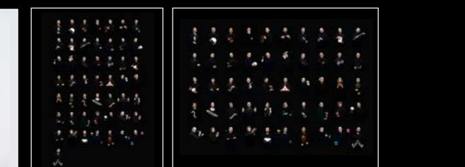
LM101 MB&F x MOSER FRIENDS PORTRAIT