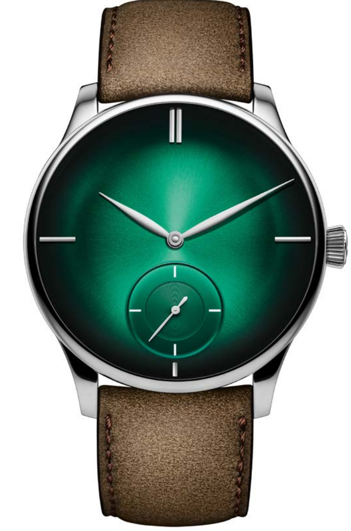
VENTURER SMALL SECONDS XL – H. MOSER & CIE.