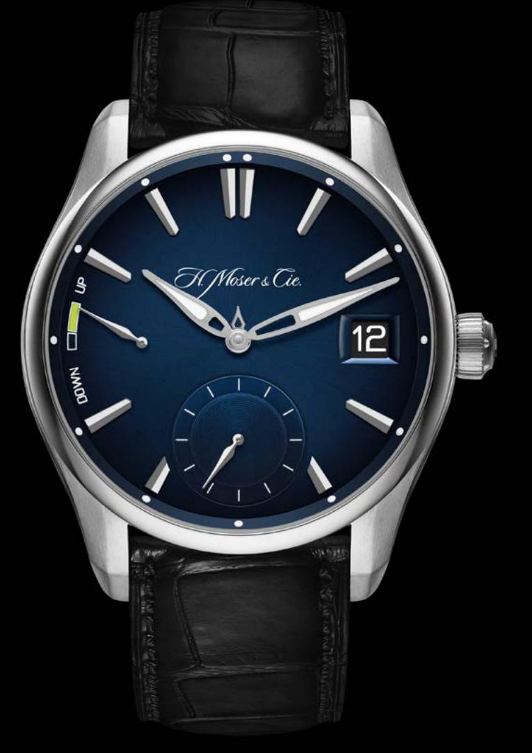
PIONEER PERPETUAL CALENDAR – H. MOSER & CIE.