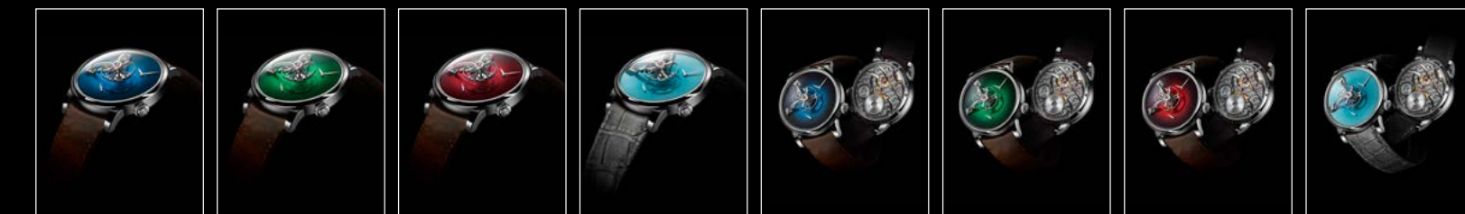
LM101 MB&F x MOSER BLUE PROFILE LM101 MB&F x MOSER GREEN PROFILE LM101 MB&F x MOSER RED PROFILE LM101 MB&F x MOSER SEDDIQI PROFILE LM101 MB&F x MOSER BLUE RECTO/VERSO LM101 MB&F x MOSER GREEN RECTO/VERSO LM101 MB&F x MOSER RED RECTO/VERSO LM101 MB&F x MOSER SEDDIQI RECTO/VERSO