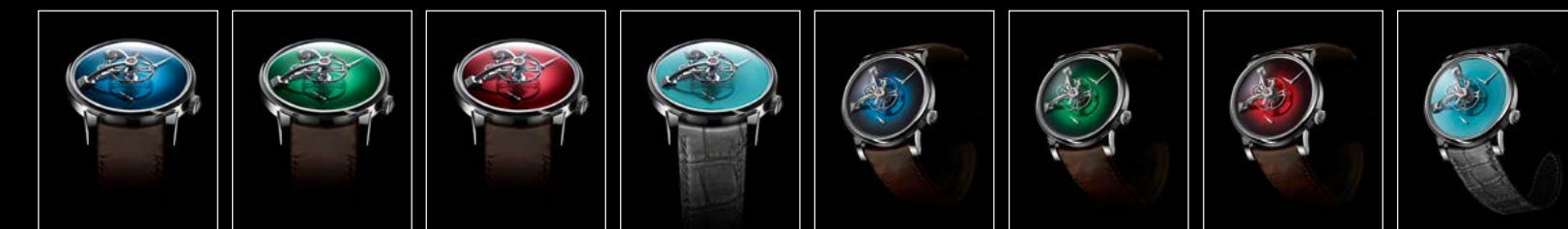
LM101 MB&F x MOSER BLUE FACE LM101 MB&F x MOSER GREEN FACE LM101 MB&F x MOSER RED FACE LM101 MB&F x MOSER SEDDIQI FACE LM101 MB&F x MOSER BLUE FRONT LM101 MB&F x MOSER GREEN FRONT LM101 MB&F x MOSER RED FRONT LM101 MB&F x MOSER SEDDIQI FRONT