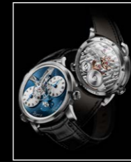
LMI XIA HANG WG