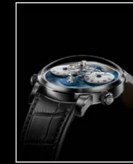
LMI XIA HANG WG FACE