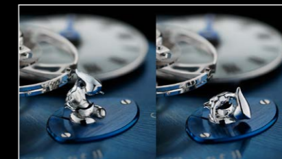
LMI XIA HANG WG POWER RESERVE MAN