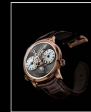
LMI XIA HANG RG FRONT