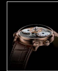
LMI XIA HANG RG FACE