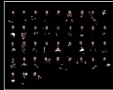
LMI XIA HANG FRIENDS