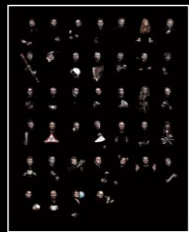
LMI XIA HANG FRIENDS