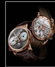
LMI XIA HANG RG