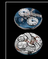
LMI XIA HANG WG