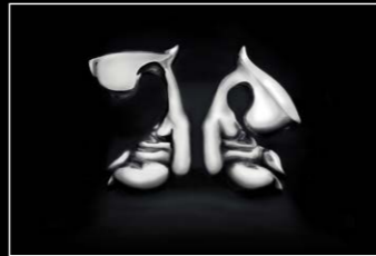
MR. UP & MR. DOWN