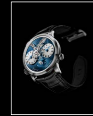
LMI XIA HANG WG FRONT