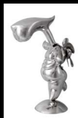
SCULPTURE 'NOT FAR'