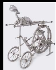
SCULPTURE 2 'COMING SOON'