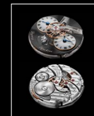
LMI XIA HANG RG