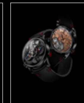
LM1 SILBERSTEIN BLACK TI