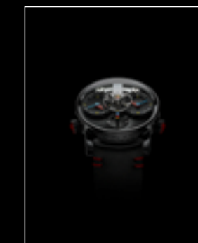
LM1 SILBERSTEIN BLACK TI FACE