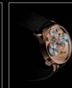
LM1 SILBERSTEIN RG PROFILE