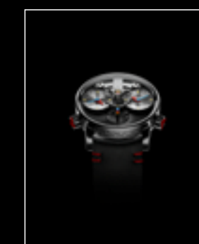
LM1 SILBERSTEIN TI FACE