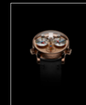
LM1 SILBERSTEIN RG FACE