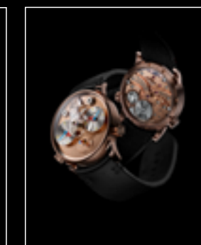
LM1 SILBERSTEIN RG