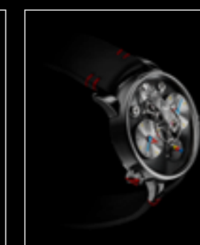
LM1 SILBERSTEIN TI PROFILE