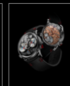
LM1 SILBERSTEIN TI