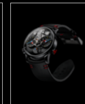
LM1 SILBERSTEIN BLACK TI FRONT