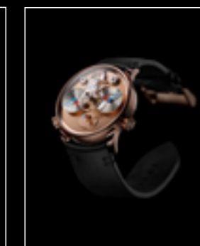
LM1 SILBERSTEIN RG FRONT