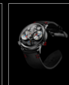
LM1 SILBERSTEIN TI FRONT