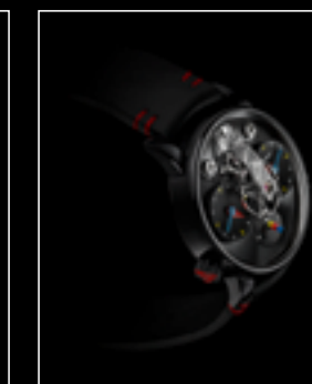
LM1 SILBERSTEIN BLACK TI PROFILE