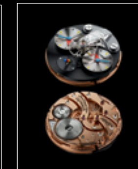
LM1 SILBERSTEIN TI ENGINE