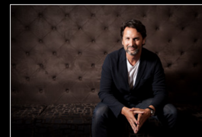
MAXIMILIAN BÜSSER PORTRAIT