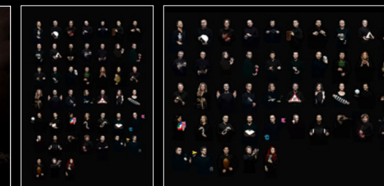
LM Flying T PORTRAIT LM Flying T LANDSCAPE