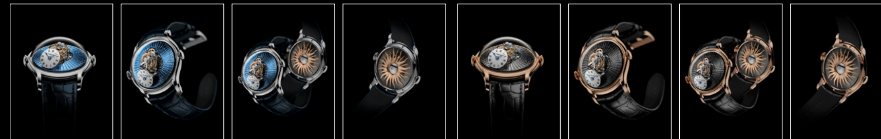
LM Flying T PT FACE LM Flying T PT FRONT LM Flying T PT LM Flying T PT BACK LM Flying T RG FACE LM Flying T RG FRONT LM Flying T RG LM Flying T RG BACK