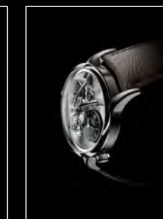
LM1 LONGHORN PROFILE