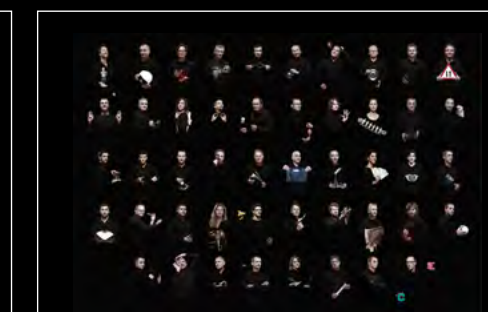
LM1 LONGHORN FRIENDS LANDSCAPE