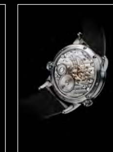
LM1 LONGHORN BACK