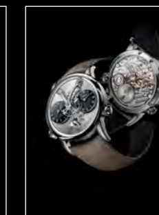
LM1 LONGHORN DUO