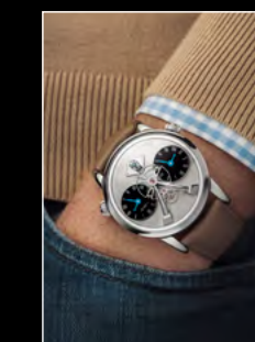
LM1 LONGHORN WRISTSHOT