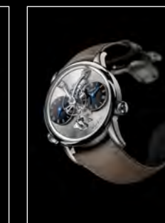
LM1 LONGHORN FRONT