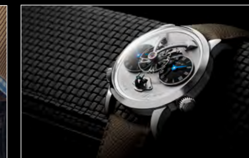
LM1 LONGHORN LIFESTYLE