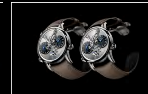
LM1 LONGHORN DUO