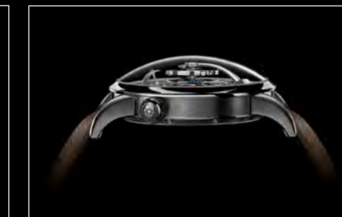
LM1 LONGHORN PROFILE 2