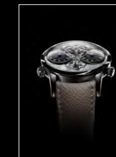
LM1 LONGHORN FACE