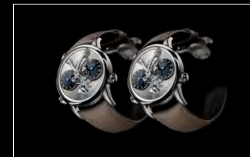
LM1 LONGHORN DUO