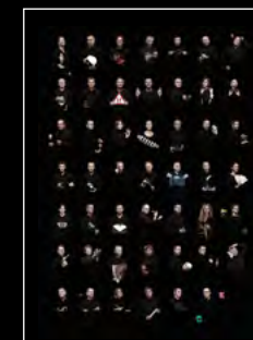
LM1 LONGHORN FRIENDS PORTRAIT