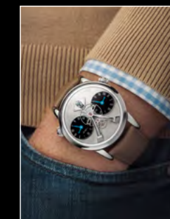
LM1 LONGHORN WRISTSHOT