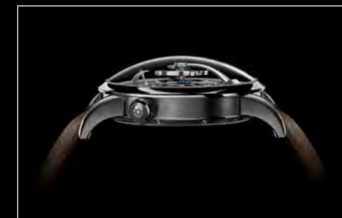
LM1 LONGHORN PROFILE 2