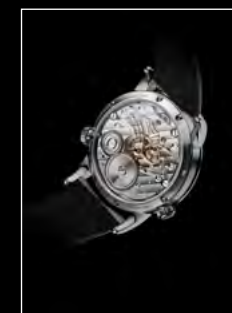
LM1 LONGHORN BACK