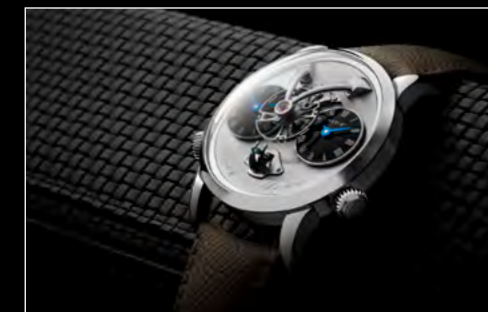
LM1 LONGHORN LIFESTYLE