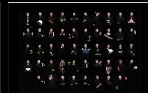
LM1 LONGHORN FRIENDS LANDSCAPE