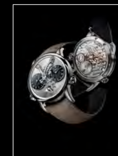
LM1 LONGHORN DUO