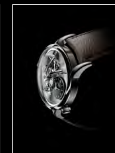
LM1 LONGHORN PROFILE