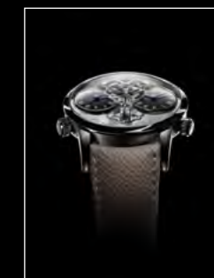
LM1 LONGHORN FACE