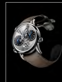
LM1 LONGHORN FRONT