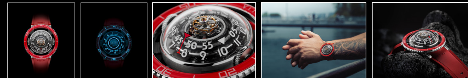
HM7 AQUAPOD PT RED TOP | HM7 AQUAPOD PT RED TOP NIGHT | HM7 AQUAPOD PT RED CLOSE-UP | HM7 AQUAPOD PT RED CLOSE-UP | HM7 AQUAPOD PT RED CLOSE-UP