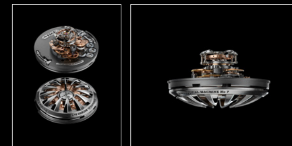
HM7 AQUAPOD ENGINE | HM7 AQUAPOD ENGIN PROFILE