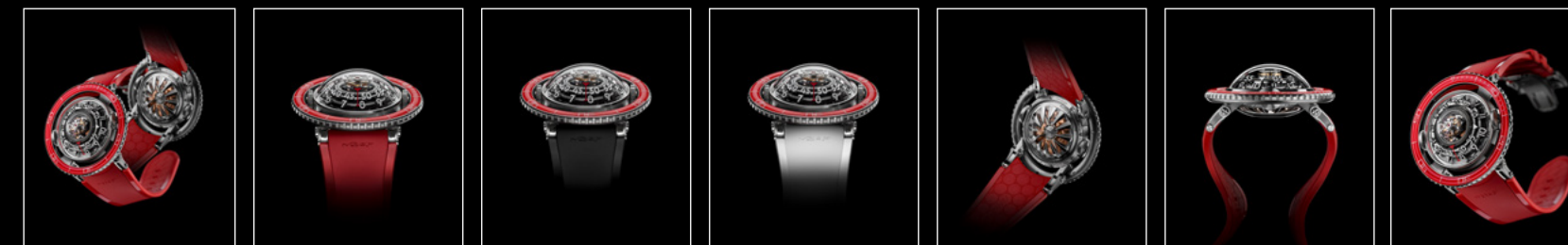
HM7 AQUAPOD PT RED | HM7 AQUAPOD PT RED FACE | HM7 AQUAPOD PT RED FACE BLACK | HM7 AQUAPOD PT RED FACE WHITE | HM7 AQUAPOD PT RED BACK | HM7 AQUAPOD PT RED PROFILE | HM7 AQUAPOD PT RED FRONT