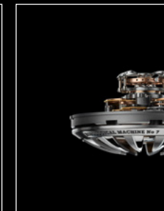
HM7 AQUAPOD ENGIN PROFILE