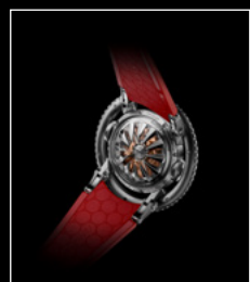
HM7 AQUAPOD PT RED BACK