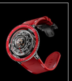
HM7 AQUAPOD PT RED FRONT