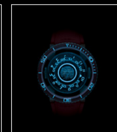
HM7 AQUAPOD PT RED TOP NIGHT