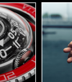
HM7 AQUAPOD PT RED CLOSE-UP