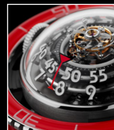
HM7 AQUAPOD PT RED CLOSE-UP