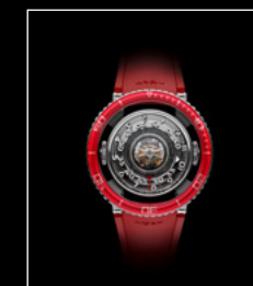
HM7 AQUAPOD PT RED TOP