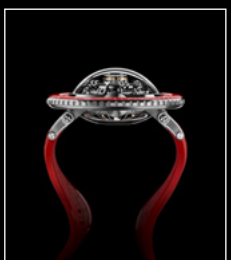
HM7 AQUAPOD PT RED PROFILE