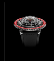
HM7 AQUAPOD PT RED FACE BLACK