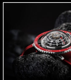
HM7 AQUAPOD PT RED CLOSE-UP