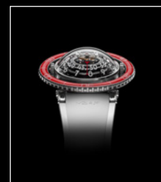
HM7 AQUAPOD PT RED FACE WHITE