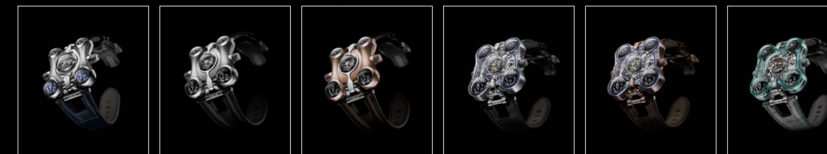
HM6 FE FRONT