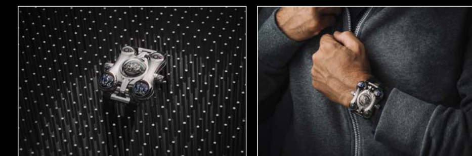
HM6 FINAL EDITION LIVE SHOT