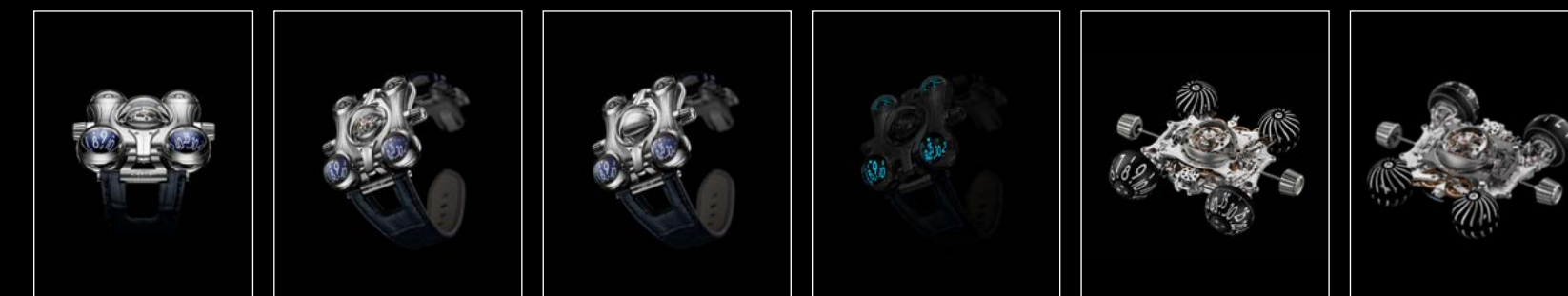
HM6 FINAL EDITION FACE