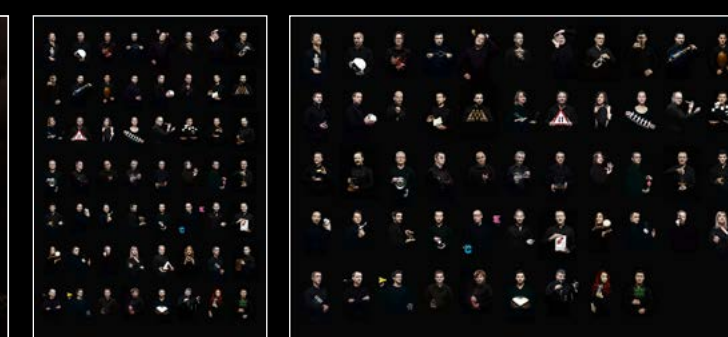
HM6 SERIES FRIENDS PORTRAIT