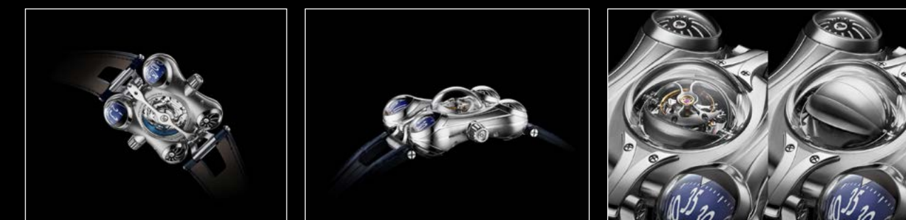
HM6 FINAL EDITION BACK