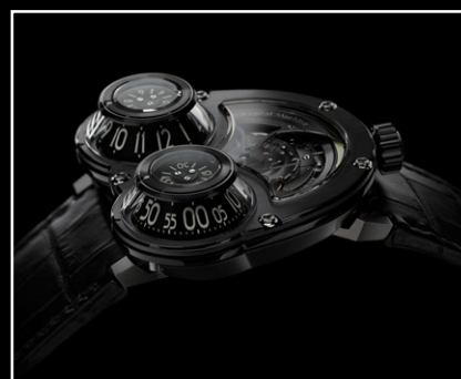
MEGAWIND FINAL EDITION PROFILE

詳細については こちらまでお問い合わせください： CHARRIS YADIGAROGLOU, MB&F SA, RUE VERDAINE 11, CH-1204 GENEVA, SWITZERLAND Eメール：CY@MBANDF.COM 電話：+41 22 508 10 33