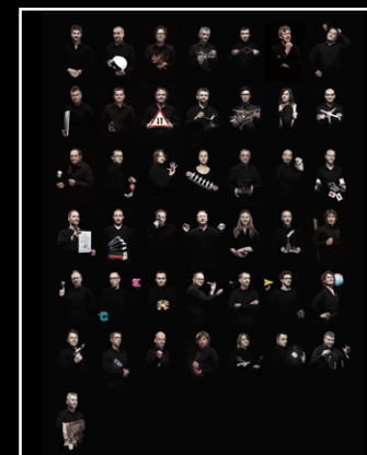
MEGAWIND FINAL EDITION FRIENDS PORTRAIT