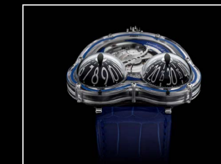
HM3 FROG X FACE BLUE