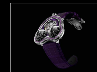
HM3 FROG X FRONT PURPLE