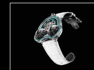
HM3 FROG X FRONT TURQUOISE