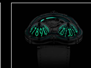
HM3 FROG X NIGHT TURQUOISE