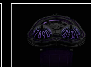
HM3 FROG X NIGHT PURPLE