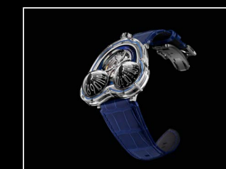
HM3 FROG X FRONT BLUE