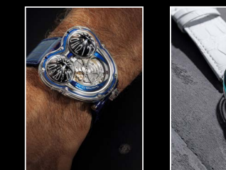
HM3 FROG X WRISTSHOT BLUE