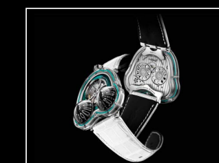
HM3 FROG X TURQUOISE