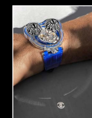
HM3 FROG X WRISTSHOT BLUE