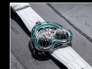
HM3 FROG X LIFESTYLE TURQUOISE