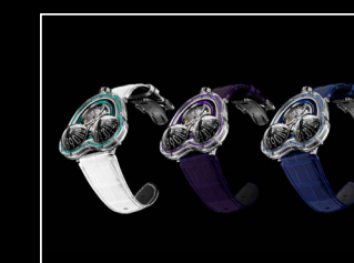
HM3 FROG X COLLECTION BLACK BACKGROUND