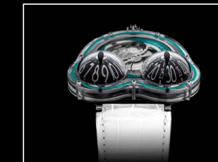
HM3 FROG X FACE TURQUOISE