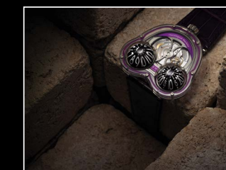
HM3 FROG X LIFESTYLE PURPLE