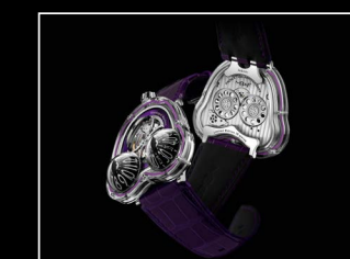
HM3 FROG X PURPLE