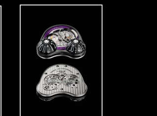
HM3 FROG X MOVEMENT PURPLE