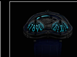
HM3 FROG X NIGHT BLUE