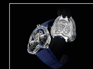
HM3 FROG X BLUE