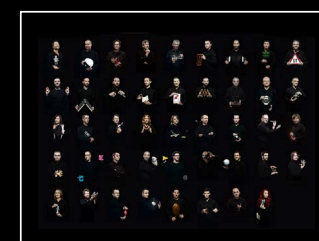
HM3 FROG X FRIENDS LANDSCAPE