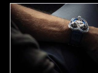
HM3 FROG X WRISTSHOT BLUE