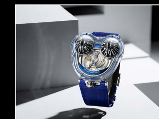
HM3 FROG X LIFESTYLE BLUE