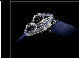
HM3 FROG X PROFILE BLUE