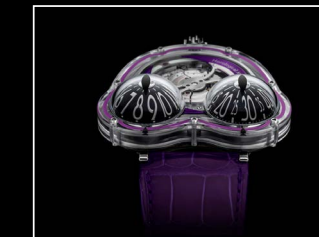
HM3 FROG X FACE PURPLE