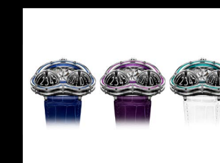
HM3 FROG X COLLECTION WHITE BACKGROUND